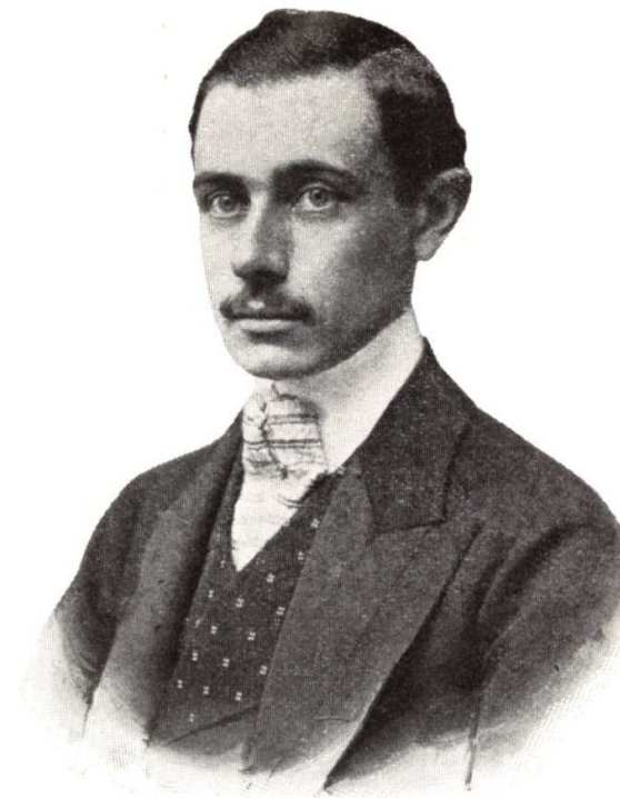
DR. TELEKI PÁL GRÓF EMLÉKÉRE